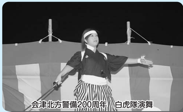
会津北方警備200周年 白虎隊演舞