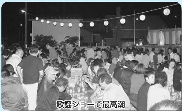
歌謡ショーで最高潮