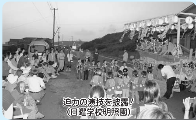
迫力の演技を披露! (目曜学校明照園)