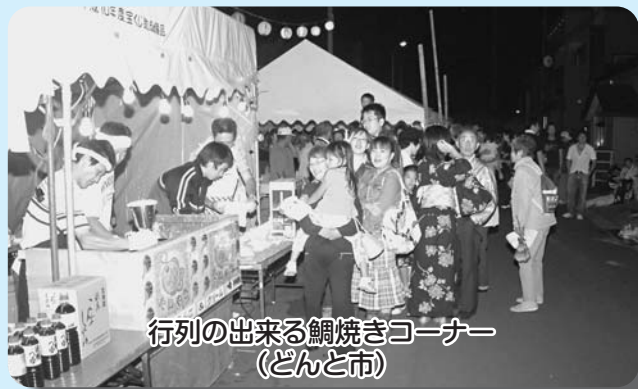
行列の出来る鯛焼きコーナー (どんと市)