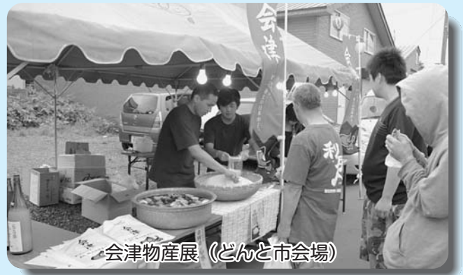
会津物産展 (どんと市会場)