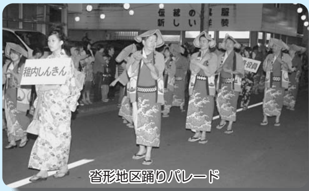
沓形地区踊りパレード