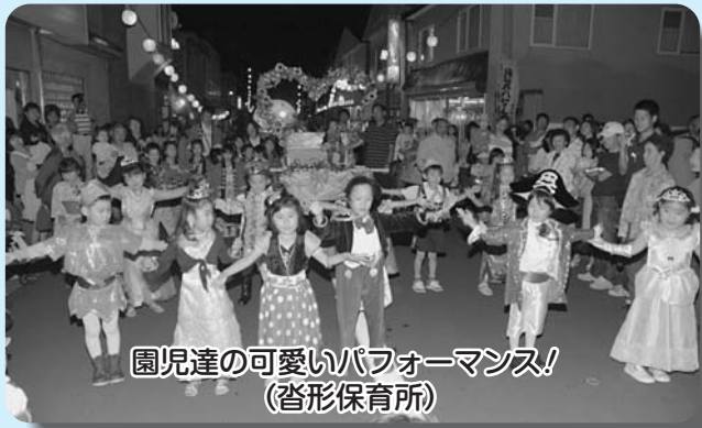
園児達の可愛いパフォーマンス! (沓形保育所)