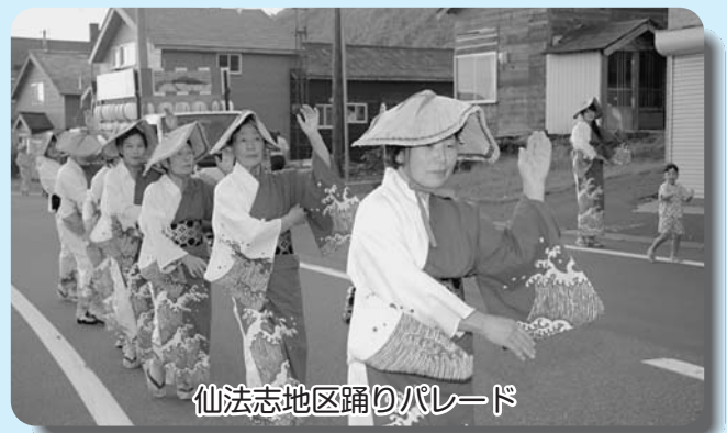
仙法志地区踊りパレード