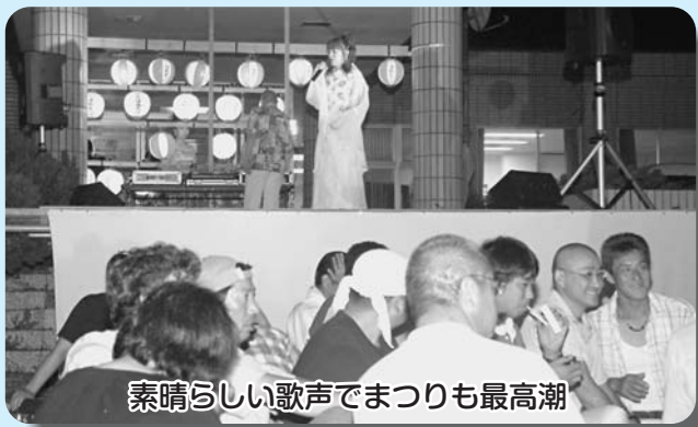
素晴らしい歌声でまつりも最高潮