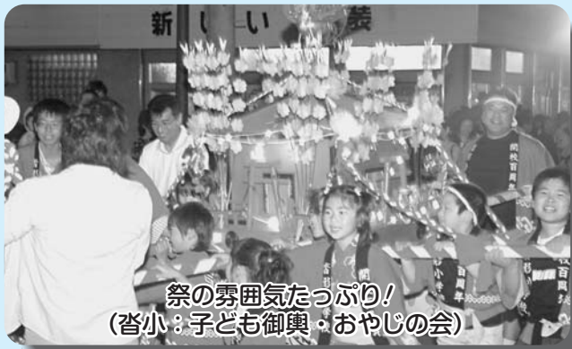
祭の雰囲気たっぷり! (沓小:子ども御輿・おやじの会)