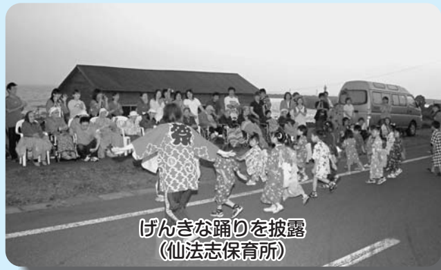
げんきな踊りを披露 (仙法志保育所)