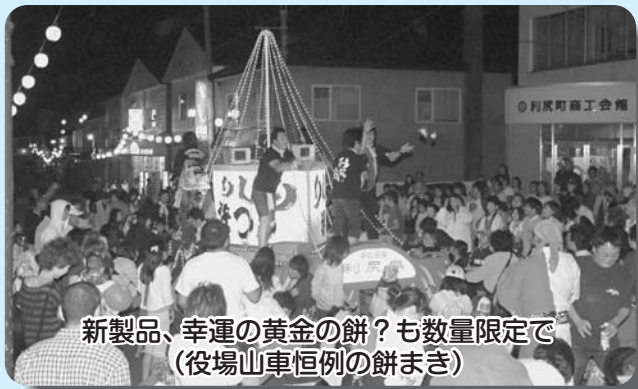
新製品、幸運の黄金の餅?も数量限定で (役場山車恒例の餅まき)