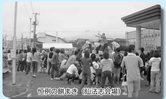
恒例の餅まき (仙法志会場)