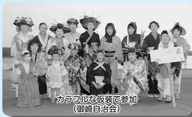
カラフルな仮装で参加 (御崎自治会)