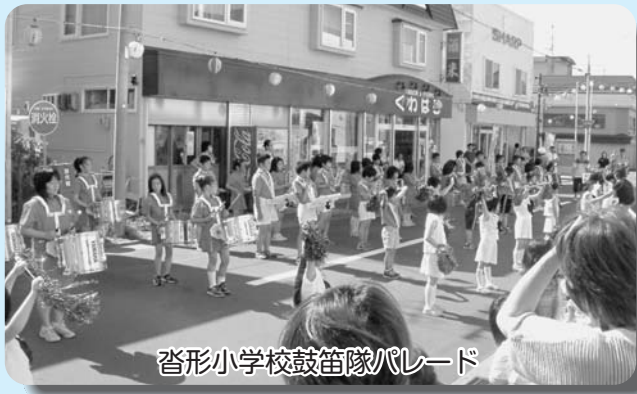
沓形小学校鼓笛隊パレード