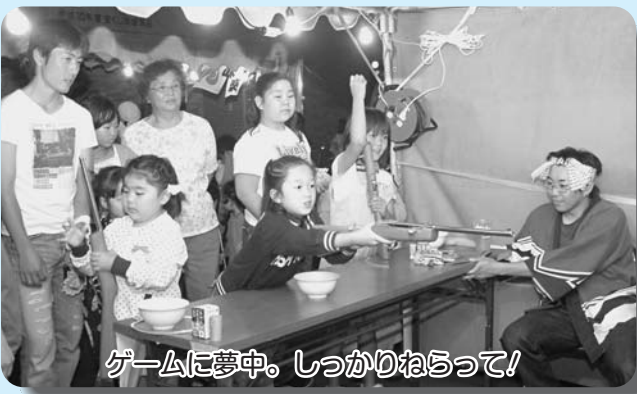
ゲームに夢中。しっかりねらって!