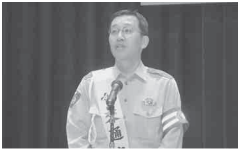
▲稚内署の今交通課長による交通安全講話