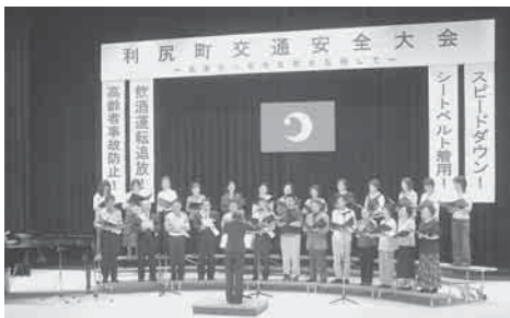
▲コーラス島の音のきれいなハーモニー

九月二十五日、交流促進施設どんとで利尻町交通安全大会が開催されました。 この大会は「北海道一安全な町を目指して」をテーマに掲げ、交通事故の根絶と町民の交通安全意識の高揚を目的として開催されました。