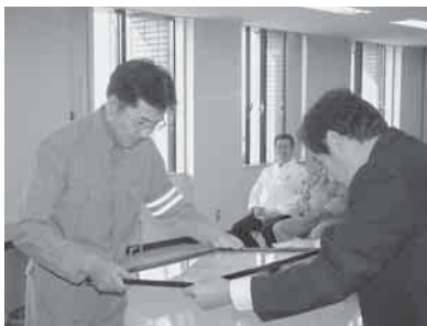
▲知事から感謝状が授与されました