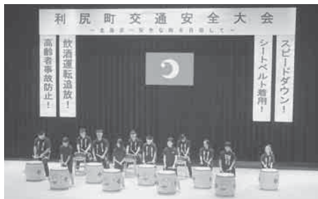
▲利尻海鳴り太鼓保存会の迫力ある太鼓演奏

当日は約二五〇人の方が参加され、来賓としてご臨席された稚内警察署の河本署長から交通事故根絶を願う挨拶の後、同署の今交通課長の交通安全講話や参加者による体験発表、更にはアトラクションとして利尻海鳴り太鼓保存会