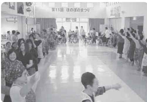
第11回 ほのぼのまつり

今年で11回目を迎える「ほのぼのまつり」が特別養護老人ホームほのぼの荘で開催されました。