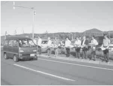
▲大磯駐輪公園にて旗を持って啓発