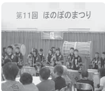
第11回 ほのぼのまつり