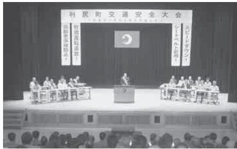
▲たくさんの方々が参加されました

九月二十五日、交流促進施設どんとで利尻町交通安全大会が開催されました。 この大会は「北海道一安全な町を目指して」をテーマに掲げ、交通事故の根絶と町民の交通安全意識の高揚を目的として開催されました。