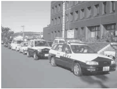
▲全12台による車輛啓発パレード