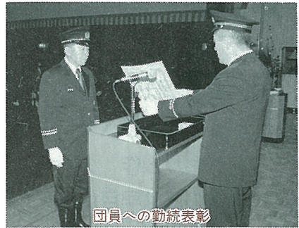
団員への勤続表彰