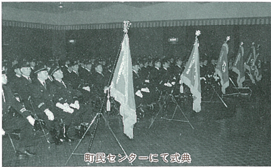
町民センターにて式典